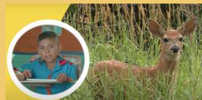
Conversación sobre animales