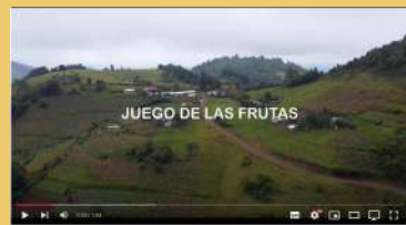
El juego de la fruta