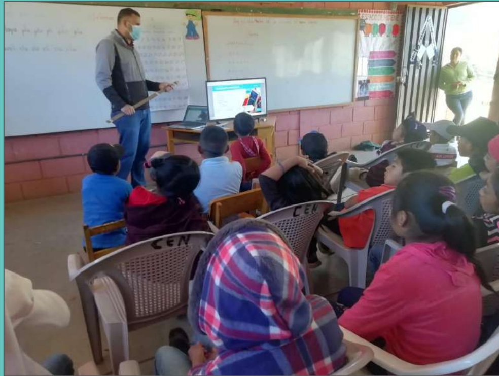
Jornada de sensibilización a estudiantes - Escuela 10 de Septiembre