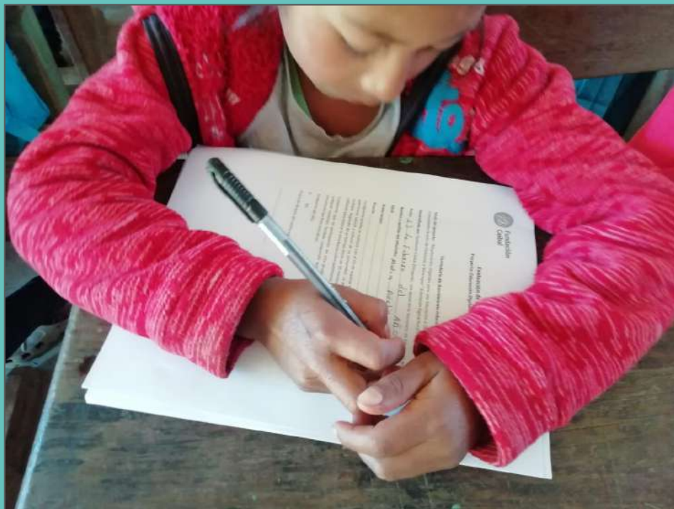
Escuela 10 de septiembre