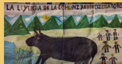
La leyenda de Chiligatoro