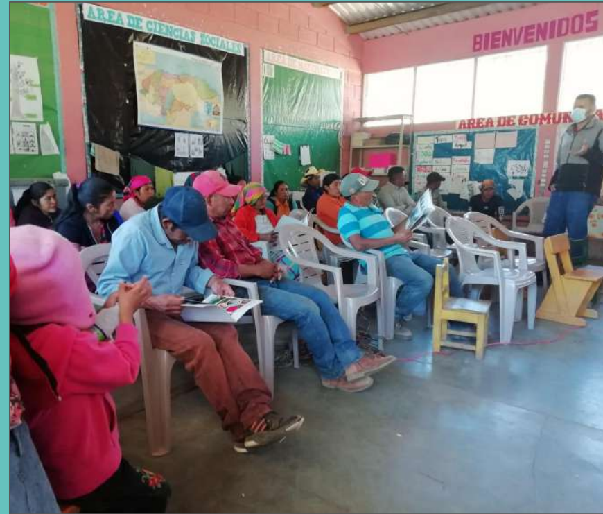
Jornada de sensibilización a familias - Escuela 10 de Septiembre