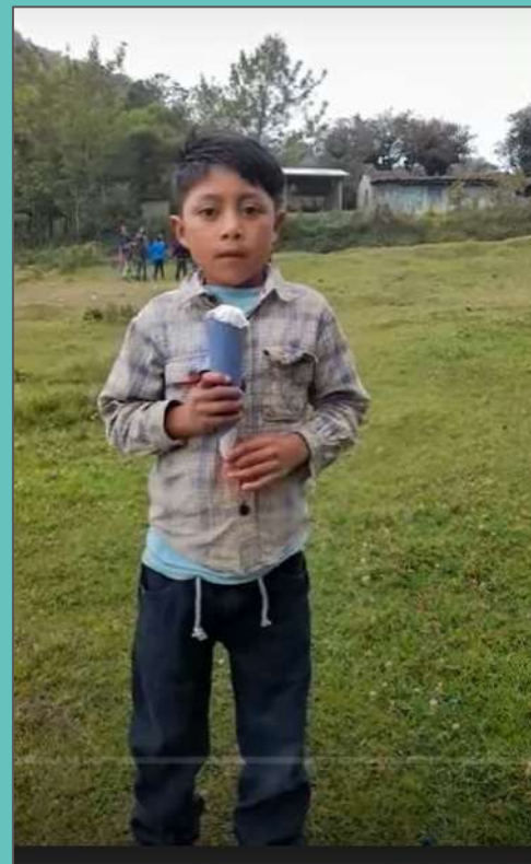
Noticiero cultural - Escuela 10 de Septiembre