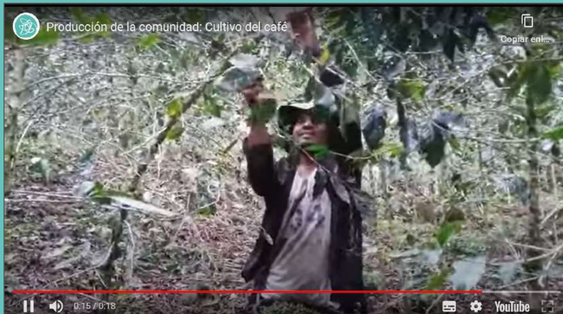
Escuela Francisco Morazán - Cosecha del café - Video realizado por una madre de un alumno